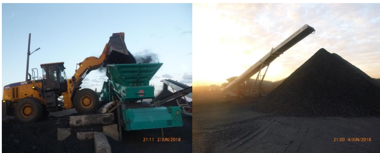
Рисунок 2 – Переработка угольной продукции через МСУ