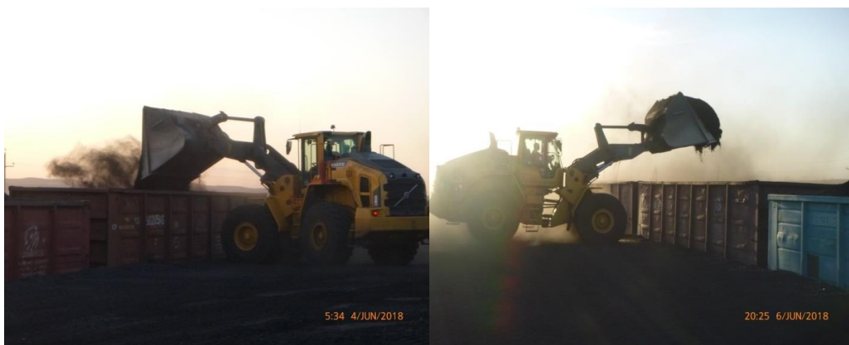
Рисунок 6 – Тупик №11. Погрузка угольной продукции в ж/д полувагоны

Отгрузка всей товарной продукции, нарабатываемой на территории предприятия, производится с территории погрузочного тупика как в страны ближнего, так и дальнего зарубежья с отбором проб ото всех отгружаемых вагонных партий и предоставления сертификатов качества угля международной инспекционной компанией.